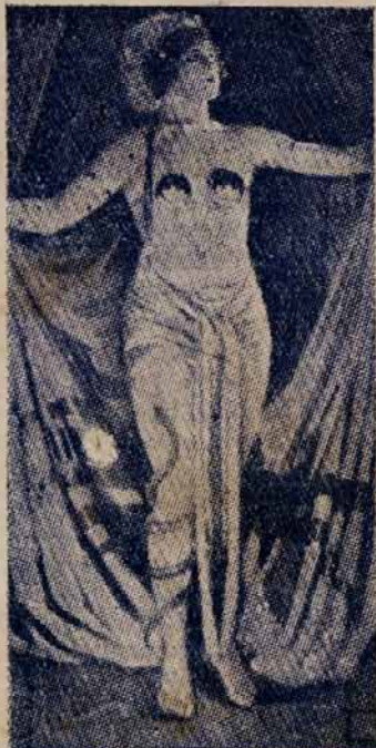
LUCIA ZANUSSI MACISTE NO INFERNO